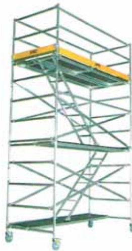
Kevyt, siirrettävä asennusteline